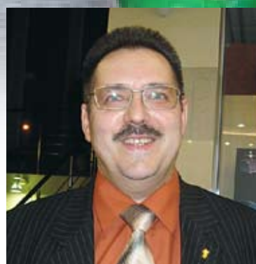
Сергей Синяков, президент Союза пресвитерианских церквей России

— Это особенный праздник, который связан еще и с тем, что весна все пробуждает к жизни. Как и у всех нормальных людей, в нашей семье пробуждаются лучшие мечты, желания, стремления. Наш праздничный семейный стол украшают куличи, различные кушанья. При том мы понимаем, что Пасха — это не куличи и даже не традиция, Пасха наша — воскресший из мертвых Христос. И вот это непрекращающееся торжество! Если на Пасху я не в командировке, то традиционно уже который год после утреннего пасхального богослужения мы вместе с семьей и друзьями выезжаем на природу, чтобы почувствовать единение с Творцом. В этот день звучит много молитв и благодарности Богу.