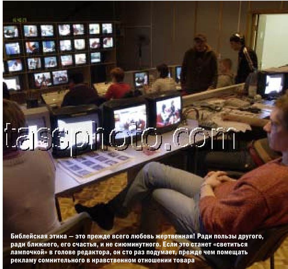
Библейская этика — это прежде всего любовь жертвенная! Ради пользы другого, ради ближнего, его счастья, и не сиюминутного. Если это станет «светиться лампочкой» в голове редактора, он сто раз подумает, прежде чем помещать рекламу сомнительного в нравственном отношении товара

Немного истории. Нравственность в любом обществе оценивается по определенным критериям. Итак, начнем с древних греков. Мораль греков была очень проста. Для себя они определили в качестве критерия счастье. Хорошим считался тот поступок, который делал человека счастливым, а плохим — поступок, который делал его несчастным. Убить человека, мешающего твоему счастью, — пожалуйста. Убить по зависти, чтобы тебе быть счастливее, — будьте любезны. Мальчику влюбиться в мужчину — все счастливые и красивые делают так... Да здравствует счастье! Есть ряд ученых, которые прямо так и заявляют, что великая культурная цивилизация Древней Греции пала именно от царящей безнравственности того общества, бесконечных болезней и уничтожения семьи,