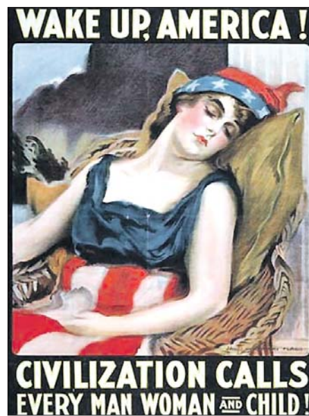
ПЛАКАТ ВОЕННОГО ВРЕМЕНИ: «ВСТАВАЙ, АМЕРИКА! ЦИВИЛИЗАЦИЯ ПРИЗЫВАЕТ КАЖДОГО МУЖЧИНУ, ЖЕНЩИНУ И РЕБЕНКА!»

вечных ценностей. Тогда в Америке говорили: «В окопах атеистов нет». Миллионы солдат и офицеров, вернувшись с войны, пришли в церкви.