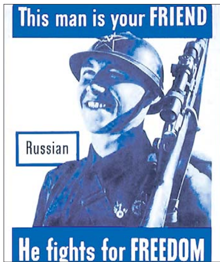
ПЛАКАТ ВОЕННОГО ВРЕМЕНИ: «РУССКИЙ. ЭТОТ ЧЕЛОВЕК — ТВОЙ ДРУГ. ОН СРАЖАЕТСЯ ЗА СВОБОДУ»

Не последнюю роль в этом сыграли американские церкви. После Перл-Харбора