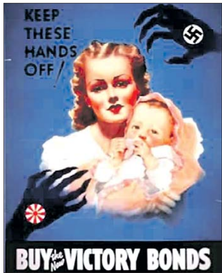
ПЛАКАТ ВОЕННОГО ВРЕМЕНИ: «РУКИ ПРОЧЬ! КУПИТЕ НОВЫЕ ОБЛИГАЦИИ ЗАЙМА ПОБЕДЫ»

По ленд-лизу Соединенные Штаты передали союзникам военного оборудования и