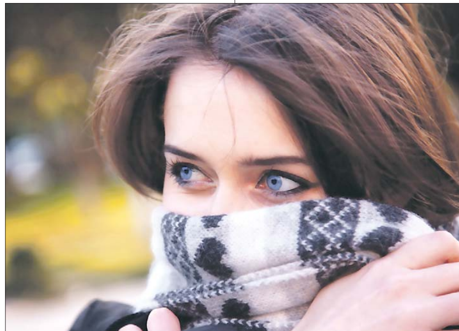
БОЛЬНЫЕ ВИЧ — ТОЖЕ ЛЮДИ! НЕ ПОВОРАЧИВАЙТЕСЬ К НИМ СПИНОЙ!