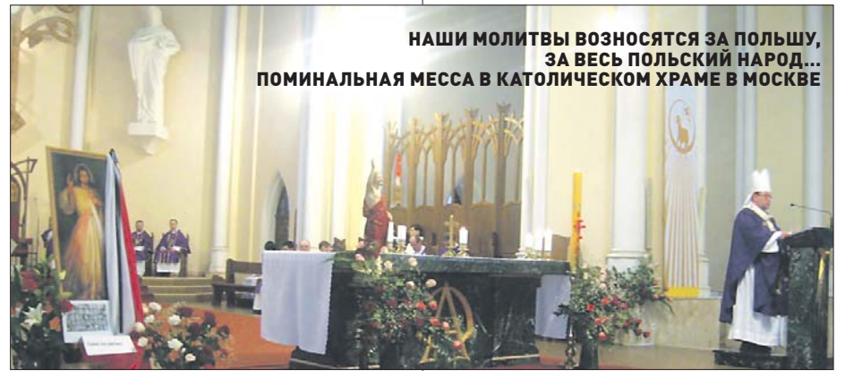
НАШИ МОЛИТВЫ ВОЗНОСЯТСЯ ЗА ПОЛЬШУ, ЗА ВЕСЬ ПОЛЬСКИЙ НАРОД... ПОМИНАЛЬНАЯ МЕССА В КАТОЛИЧЕСКОМ ХРАМЕ В МОСКВЕ

— Хотя я православный, но посчитал своим долгом прийти в католический храм на поминальную мессу, чтобы поклониться всем, кто погиб в этот скорбный час не только для польского, но и для русского народа. Я храню светлую память о польском народе — помню рассказы сестры, которая в Великую Отечественную воевала вместе с польским