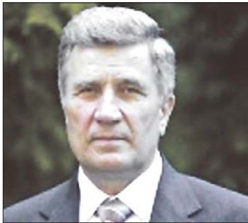
ВЛАДИМИР ШЕМЧИШИН — ЗАМЕСТИТЕЛЬ ПРЕДСЕДАТЕЛЯ ВСЕУКРАИНСКОГО СОЮЗА ЦЕРКВЕЙ ЕХБ