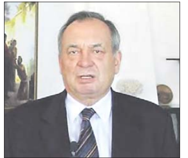
ГРИГОРИЙ КОМЕНДАНТ — ПРЕДСЕДАТЕЛЬ ДУХОВНО-КОНСУЛЬТАТИВНОГО СОВЕТА ВСЕУКРАИНСКОГО СОЮЗА БАПТИСТОВ

площадкам подготовки и отправки служителей в страны бывшего СССР и Азии.