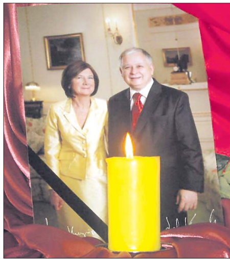
ЛЕХ И МАРИЯ КАЧИНСКИЕ БЫЛИ НАСТОЯЩИМИ ПОЛЯКАМИ

» «...С каждой весной на землю приходит жизнь... Но этой весной произошел какой-то непонятный метафизический или, скорее, моральный, сбой — земная жизнь Президента Польши Леха Качиньского, его супруги Марии и еще 96 выдающихся мужей Польши остановилась. Скорбь поляков огромна. Скорбь всего цивилизованного мира не знает границ...» Это строки из соболезнования Ассоциации славянских иммигрантов США в лице Василия Ступина по случаю гибели президента Польши.