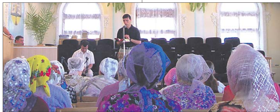
ПОКРЫТЫЕ ГОЛОВЫ ЖЕНЩИН В ЦЕРКВИ — ЗНАК СМИРЕНИЯ ИЛИ РЕЛИГИОЗНОСТИ?

Именно поэтому, прежде чем говорить о применении 11 главы 1 Послания Коринфянам к современным реалиям, мы должны ответить на все вопросы, связанные со смыслом поведения, данного первым читателям этого послания. Давайте рассмотрим эти вопросы по порядку.