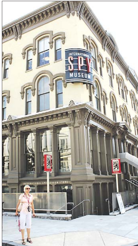
МЕЖДУНАРОДНЫЙ МУЗЕЙ ШПИОНАЖА В ВАШИНГТОНЕ