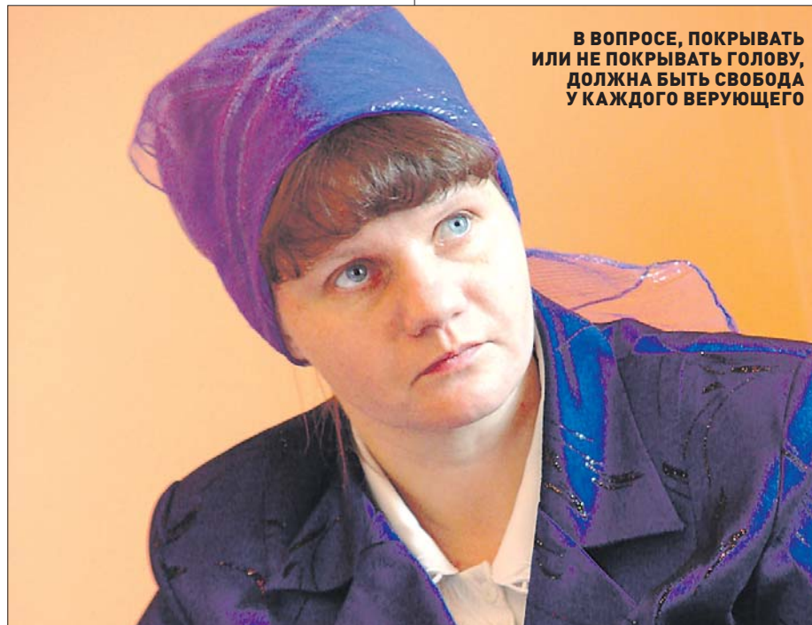
В ВОПРОСЕ, ПОКРЫВАТЬ ИЛИ НЕ ПОКРЫВАТЬ ГОЛОВУ, ДОЛЖНА БЫТЬ СВОБОДА У КАЖДОГО ВЕРУЮЩЕГО

Нет ли тут мужского шовинизма? «Впрочем, ни муж без жены, ни жена без мужа,