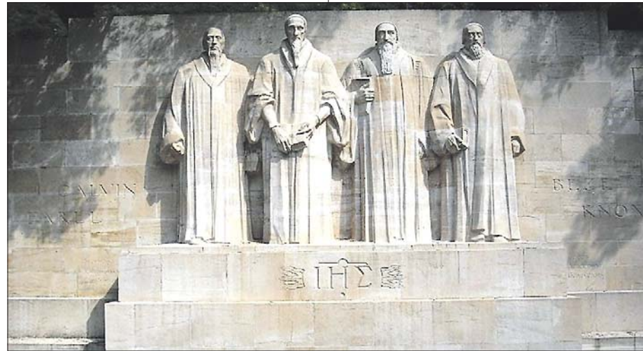
СТЕНА РЕФОРМ В ЖЕНЕВЕ (ШВЕЙЦАРИЯ) ЗАПЕЧАТЛЕЛА В КАМНЕ ВЕЛИКИХ РЕФОРМАТОРОВ ЕВРОПЫ — ФАРЕЛА, КАЛЬВИНА, НОКСА И БЕЗУ.

Казалось бы, все хорошо, оставайся верным Христу и наслаждайся Божьей благодатью и будущими благословениями. Однако драматические конфликты человеческого «я» с волей Бога продолжались до конца земной истории человечества. Обратимся к известной притче о брачном пире (Мтф 22:1-14). Здесь говорится о событиях Второго пришествия Христа: «Царство Небесное подобно человеку царю, который сделал брачный пир для сына своего» (Мтф 22:2). Царь (Господь) истребит не только неверных, но и тех, кто когда-то принял Христа как Спасителя, получил от Царя богатые благословения (приглашение на пир), но не подготовил себя к встрече с Его сыном (Воскресшим Христом). Их дела, земные заботы оказались для них более важными, чем повеление