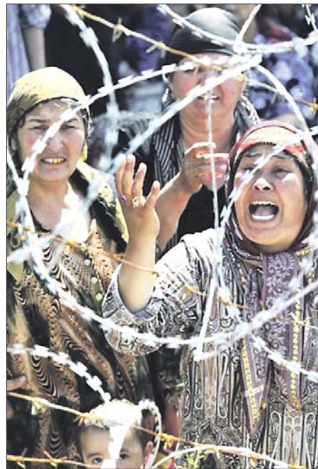
ПОСЛЕ СОБЫТИЙ НА ЮГЕ КЫРГЫЗСТАНА 40 ТЫСЯЧ БЕЖЕНЦЕВ ОСТАВИЛИ СВОИ ДОМА...

— На юге ситуация несколько успокоилась, но, как нам кажется, это только внешнее спокойствие и временное затишье, потому что боевики продвигаются сейчас сюда, к центру, в Чуйскую долину и в Ферганскую долину, ожидаются крупномасштабные военные действия и