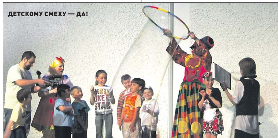
ДЕТСКОМУ СМЕХУ — ДА!