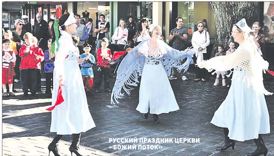
РУССКИЙ ПРАЗДНИК ЦЕРКВИ «БОЖИЙ ПОТОК»

Первые приезжие из Российской империи появились в Новой Зеландии в 1860-х годах, в период золотой лихорадки. За ними последовали евреи, бежавшие из России от гонений, выходцы из Прибалтики, Украины, российские немцы из Поволжья. К 1916 году в Новой Зеландии проживало чуть больше 1200 русскоязычных мигрантов. После этого их приток значительно снизился и возобновился только после окончания Второй мировой войны. В Новую Зеландию переезжали как российские эмигранты «первой волны», проживавшие